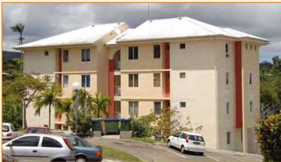
La résidence Belle Étoile, l'une des nombreuses résidences gérées par la SMHLM

«La Société Martiniquaise d'HLM, spécialisée dans la construction et la gestion de logements locatifs sociaux, emploie 138 salariés. Nous n'étions pas satisfaits du rapport qualité/prix de notre mutuelle précédente. La SMHLM a donc consulté plusieurs autres mutuelles concurrentes, dont la Mutuelle Mare-Gaillard et elle a soumis ces propositions à l'ensemble des salariés. Ces derniers ont opté pour la Mutuelle Mare-Gaillard. La décision a été prise en décembre 2012 et il fallait que tous les 138 salariés soient affiliés à la Mutuelle Mare-Gaillard au 1er janvier 2013. Un véritable challenge !